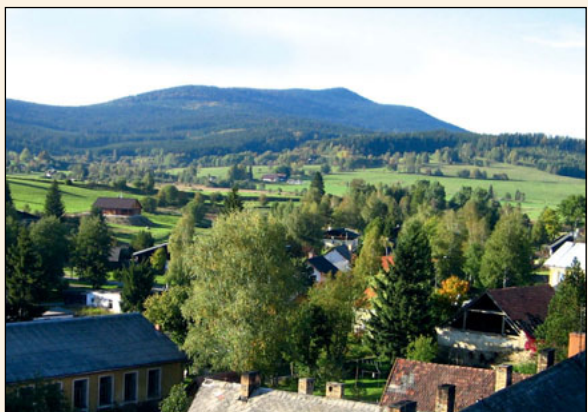
Výhled na město a okolí z věže kostela sv. Kateřiny.

V září 2006 byla poprvé mimořádně zpřístupněna věž kostela veřejnosti.